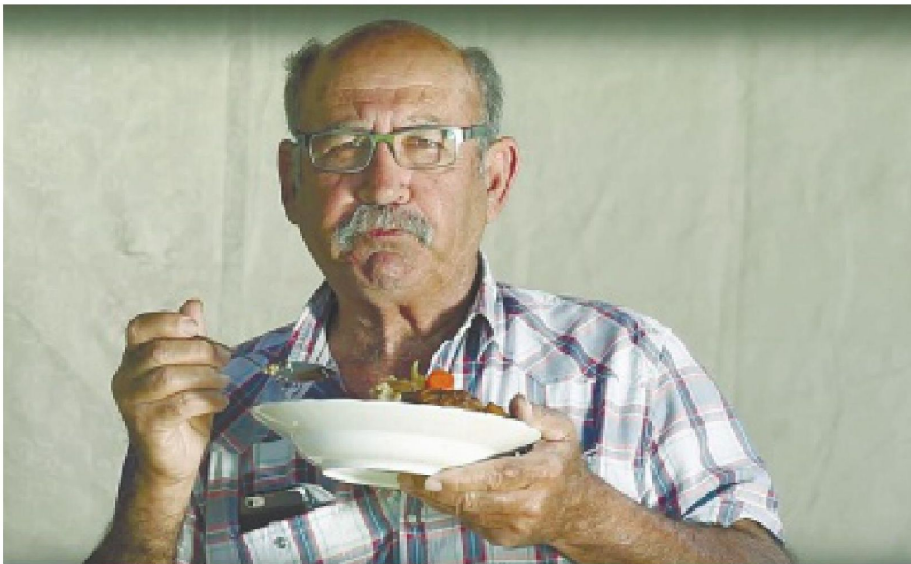
למעלה: תמיר צדוק, מתוך "מסמן טריטוריה", 2010; אלמוג גז, מתוך "קוסקוס", 2016

"זהב שחור לבן". אוצר: איציק הרוש. הגלריה ע"ש מורל דרפלו, רחוב הע"ח 9 ירושלים. שעות פתיחה: א'-ה' 10:00-17:00. עד 10.5