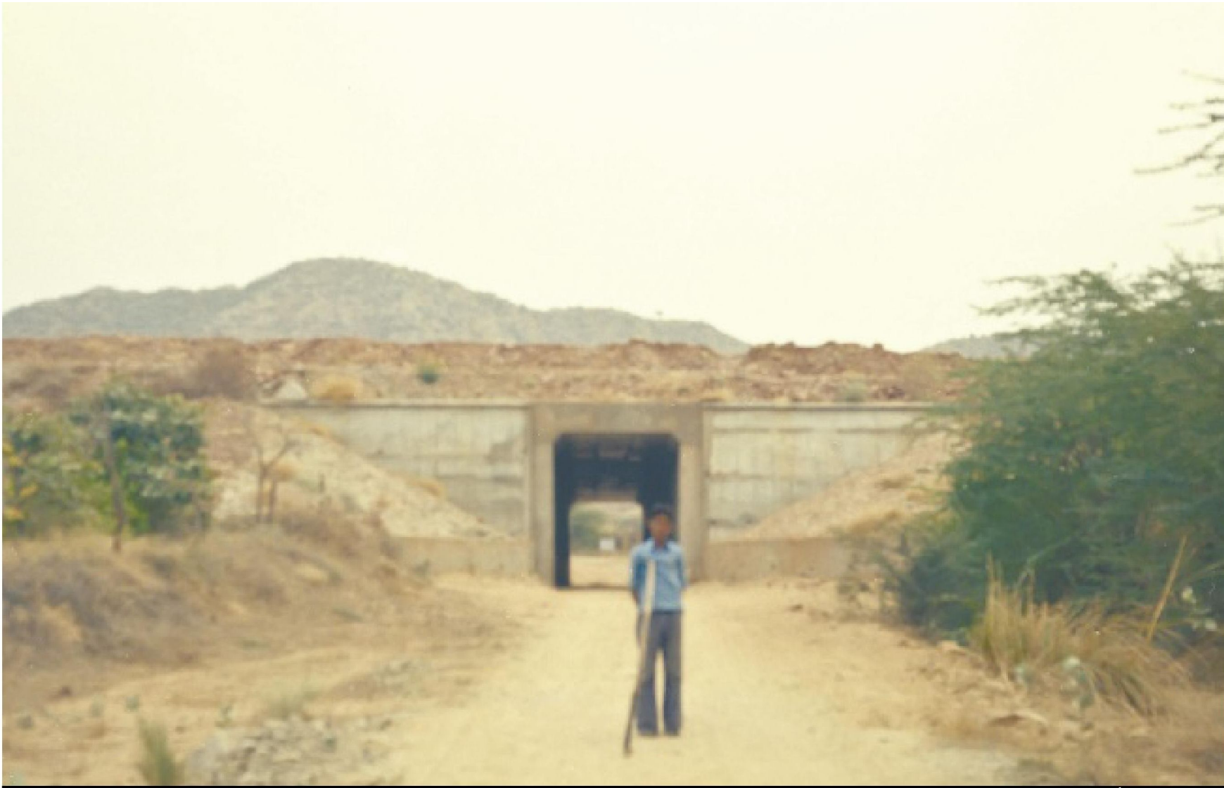
תערוכה גליה ירב